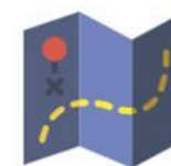
Adicionar informações de endereço