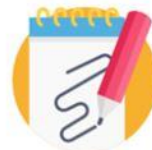
Desenhar e ilustrar itens