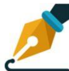
Adicionar assinatura eletrônica