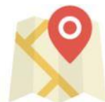
Geocalize e navegue