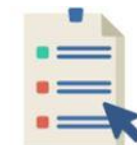
Adicionar lista de um banco de dados