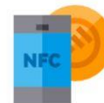
Digitalizar etiqueta NFC