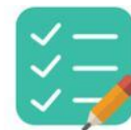
Lista de verificação da opção